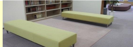
プレイコーナーの様子