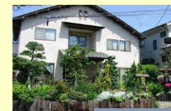
よこはまファミリー ハウス